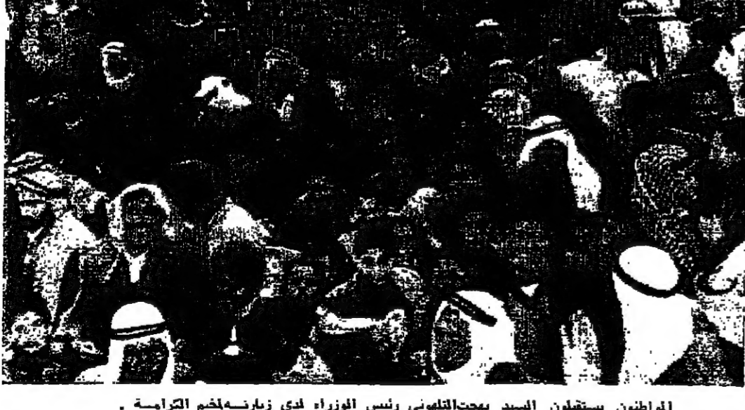
الرئيس التلهوني وبعض الوزراء أثناء زيارتهم لمخيم الكرامة

«أنا صديقك على نيل عبقنا كما ملأنا ودينا في مقدرة ما نقتدي بالأوطان» عمان - كتب مندوب «الدستور» الخاص يقول: تجلت يوم أمس حقائق الاخوة المتلاحمين المتعاطفين الصانين بين أبناء الاسرة الاردنية في اروع مظاهرها حين اجتمع السيد بهجت التلهوني رئيس الوزراء وعبدمنن الوزراء الى اخوانهم من القارئ والمواطن في مخيم الكرامة الذي تعرض يوم الخميس الماضي لعشود اسرائيل التي غادرها موكب الرئيس